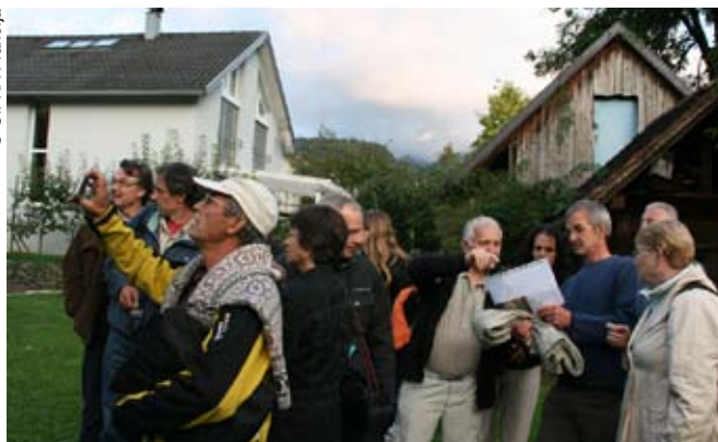
Konstruktivna izmenjava izkušenj med predavatelji in udeleženci študijskega potovanja na Predarlškem (Vorarlberg/AT).