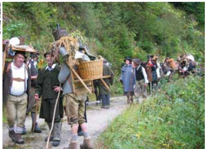
Historische Saumwege im Achental – das DYNALP 2 -Projekt hat in der Region das Interesse für die gemeinsame Geschichte geweckt.