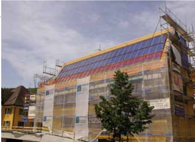
Umbau des Verwaltungsbäudes in Mauren/FL.