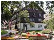
Soziale Handlungsfähigkeit: Lebensqualität in Oberstaufen