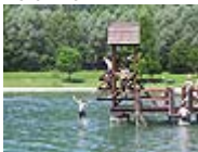
Soziale Handlungsfähigkeit: Lebensqualität See

Die Projekte in den Gemeinden sind Kernpunkt und größter Budgetposten von DYNALP2. Weiterer Schwerpunkt sind gemeinsame Veranstaltungen wie Workshops, Exkursionen und internationale Tagungen. Diese werden die alpenweite Vernetzung der Gemeinden fördern und damit lokal vorhandenes Wissen für viele nutzbar machen. DYNALP2 hat eine Projektlaufzeit von etwas mehr als drei Jahren, von April 2006 bis Juni 2009, und wird von der MAVA-Stiftung für Naturschutz in der Schweiz gefördert.