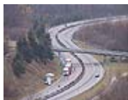
Freizeit-, Tourismus- und Pendlerverkehr: LKW Autobahn

Alpenschutzkommission CIPRA zur Förderung einer zukunftsfähigen Entwicklung im Alpenraum. Menschen, Unternehmen und Institutionen sollen sich vernetzen, um Wissen und Informationen auszutauschen, umzusetzen und damit neue Impulse für eine nachhaltige Entwicklung in den Alpen zu geben. Die CIPRA leistet mit dem Projekt einen Beitrag zur Umsetzung der Alpenkonvention.