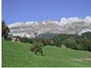
Schutzgebiete: Biologische Vielfalt alpiner Landschaft