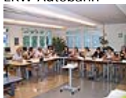
Neue Formen der Entscheidungsfindung: Workshop