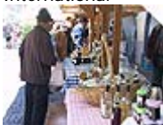
Regionale Wertschöpfung: Spezialitäten auf dem Bauernmarkt Feldkirch

Thematisch sollen die Projekte eines der sechs Themen behandeln: "Regionale Wertschöpfung", "Soziale Handlungsfähigkeit", "Schutzgebiete", "Mobilität", "Neue Formen der Entscheidungsfindung", "Politiken und Instrumente". Die international besetzte Jury wird bei der Auswahl auf die Nachhaltigkeit des Projekts achten: Wer bringt ökologische, wirtschaftliche und sozio-kulturelle Interessen am besten in Einklang? Wer hat Ideen, die übertragbar auf andere Gemeinden und Regionen sind und dem Thema Nachhaltigkeit mehr Aufmerksamkeit in der Öffentlichkeit erschaffen?