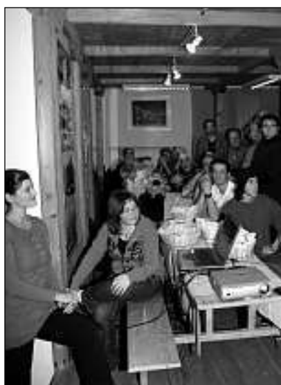
Dals 25 ex-giarsuns s'han inscuntrats in sonda 20 per festagiar insembel.